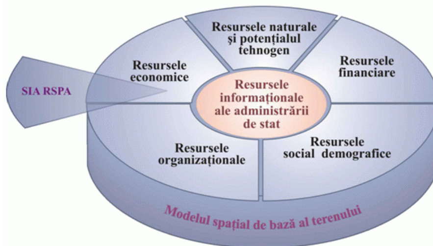
Fig.1. Locul SIA RSPA în structura Resurselor informaționale de stat